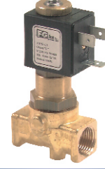
2/2 - N.A. Servo Destekli Pistonlu