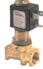
2/2 - N.K. Pistonlu Buhar