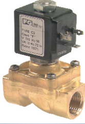
2/2 - N.K. Servo Destekli Pistonlu