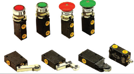
C 3/2 Valfler