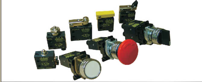
M 3/2 Valfler